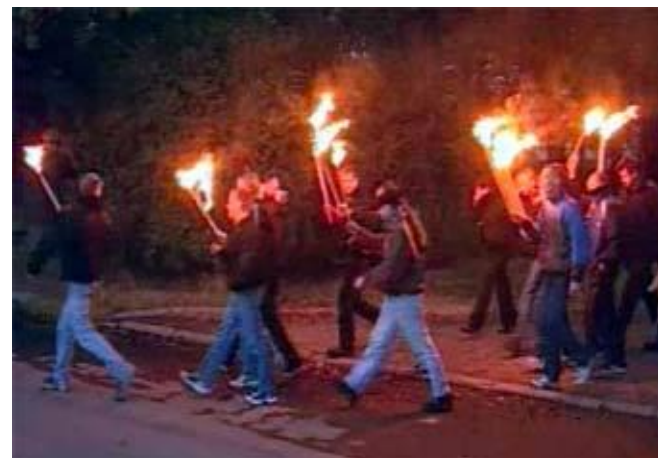
Скинхеды. Факельное шествие в Петербурге.