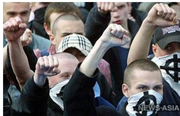
В Костроме скинхеды напали на неформалов