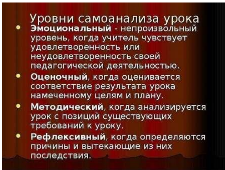
Рис. 3. Уровни самоанализа урока

Современная педагогическая наука знает девять видов самоанализа , где каждый акцентирует внимание на отдельной составляющей занятия (Приложение 1).