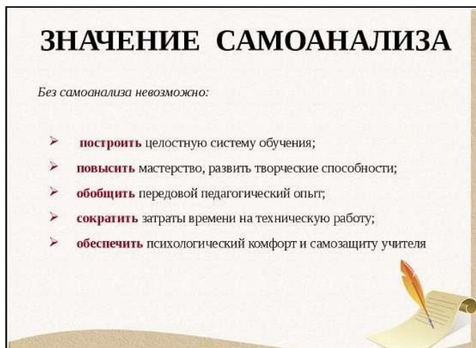
Рис. 2. Значение самоанализа урока для учителя

иных учебно-воспитательных задач на уроках, принять их во внимание при дальнейшем проектировании учебно-воспитательного процесса. Для учителя самоанализ урока, рефлексивная деятельность в целом приобретает особо важное значение, потому что учитель, не научившийся осмысливать свои собственные действия, не умеющий оглянуться назад и восстановить ход урока, навряд ли когда-нибудь по-настоящему глубоко освоит ФГОС второго поколения (рис. 2).